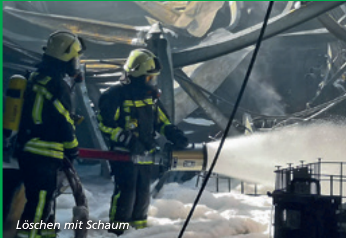
Löschen mit Schaum