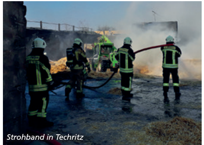
Strohband in Techritz