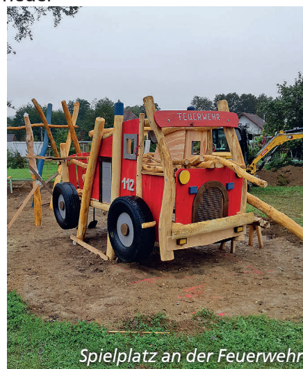
Spielplatz an der Feuerwehr

Elektro Lehmann bedankt sich bei seinen Kunden für das entgegengebrachte Vertrauen im Jahr 2021 und wünscht Allen eine schöne Weihnachtszeit!