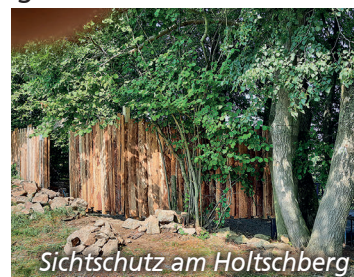
Sichtschutz am Holtschberg