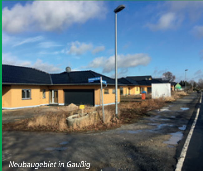
Neubaugebiet in Gaußig