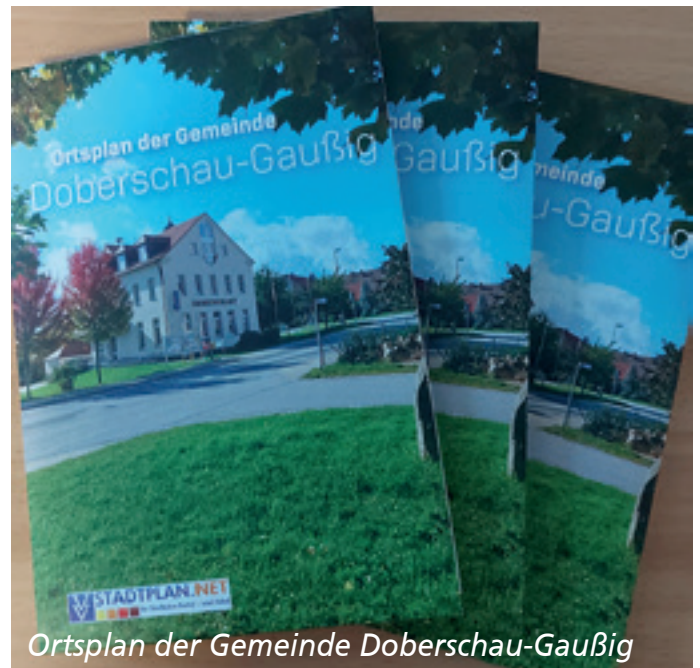
Ortsplan der Gemeinde Doberschau-Gaußig

Jahren sind zahlreiche Wanderrouten, Wegeschilder und attraktive Rastplätze entstanden, die tolle Ausblicke in unserer schönen Heimat ermöglichen.