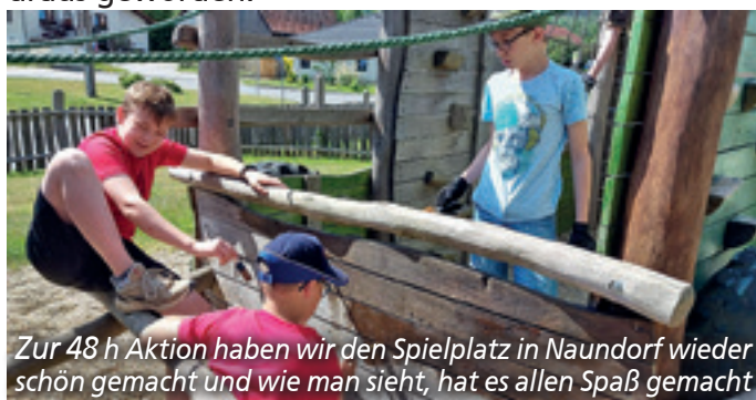
Zur 48 h Aktion haben wir den Spielplatz in Naundorf wieder schön gemacht und wie man sieht, hat es allen Spaß gemacht