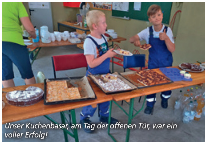
Unser Kuchenbasar, am Tag der offenen Tür, war ein voller Erfolg!