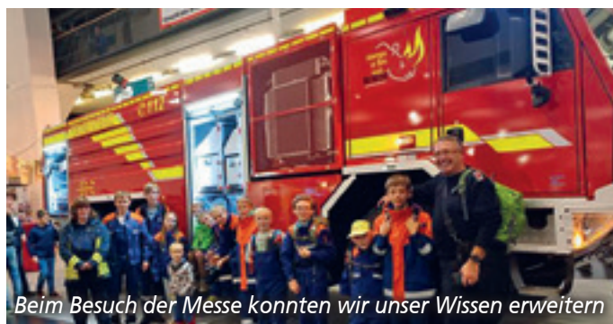
Beim Besuch der Messe konnten wir unser Wissen erweitern