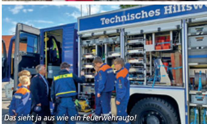
Das sieht ja aus wie ein Feuerwehrauto!