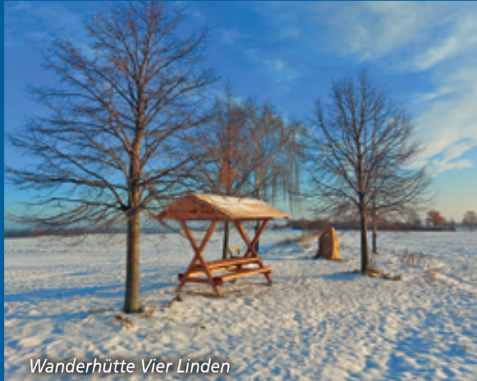
Wanderhütte Vier Linden