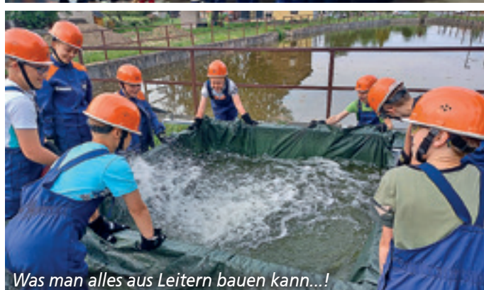
Was man alles aus Leitern bauen kann...!