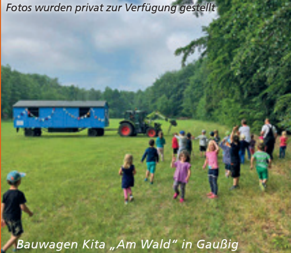
Bauwagen Kita „Am Wald“ in Gaußig