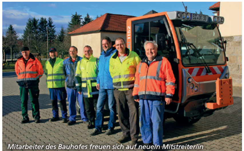
Mitarbeiter des Bauhofes freuen sich auf neue/n Mitstreiter/in

Endlich ist es Osterzeit, es wird langsam wärmer. Auch der Osterhase ist bereit und bald um viele Eier ärmer. Die Mitglieder der Redaktion wünschen allen großen und kleinen Lesern ein wunderschönes Osterfest mit viel Sonnenschein.