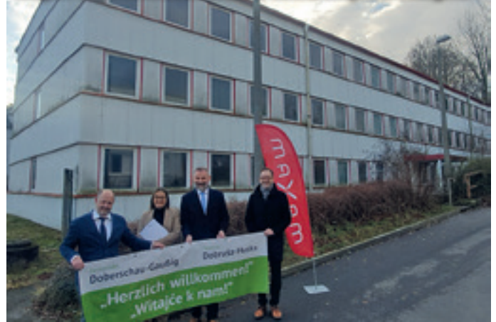
Übergabe des Fördermittelbescheides vor dem Abrissobjekt in Schlungwitz

Die Entwicklung des Projektes durch die Gemeindeverwaltung erfolgte seit dem Jahr 2020 in enger Abstimmung mit den umliegenden Gewerbetreibenden und Unternehmen. Nachdem das Projekt mehrere Gremien durchlaufen hatte und nunmehr sowohl den Regionalen Begleitausschuss als auch die Entscheidungsträger im Freistaat Sachsen und beim Bund überzeugt hat, können wir nun in die Realisierung gehen. Im ersten Schritt erfolgt die Bindung eines Planungsbüros, unter dessen fachlicher Leitung das Projekt bis Anfang 2025 umgesetzt und abgeschlossen werden soll. Burkhardt, Sachbearbeiterin Hochbau