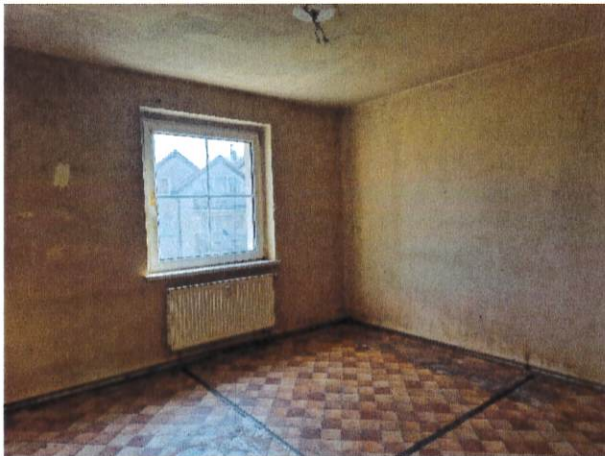
Foto 1 Zustand Küche

Die langjährigen Mieter der Wohnung sind verstorben bzw. in eine Pflegeeinrichtung gezogen. Daraufhin erfolgte die Übergabe der Wohnung an den Vermieter durch die Betreuerin Ende August 2025. Die Wohnung befindet sich in einem sehr schlechten baulichen Zustand.