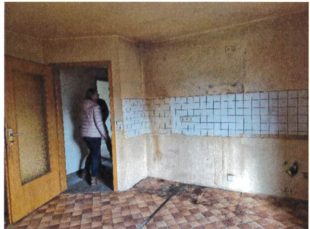
Foto 2 Zustand Küche