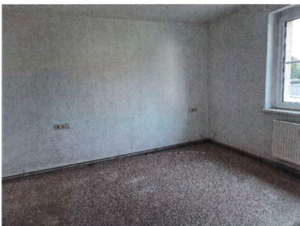
Foto 3 Zustand Schlafzimmer