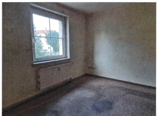
Foto 4 Zustand Wohnzimmer