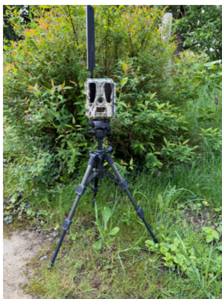
Eine beispielhafte Wildkamera mit Mobilfunkanbindung auf einem Stativ befestigt. In der Regel wird ein Textilgurt mitgeliefert der eine Befestigung an Bäumen etc. ermöglicht.