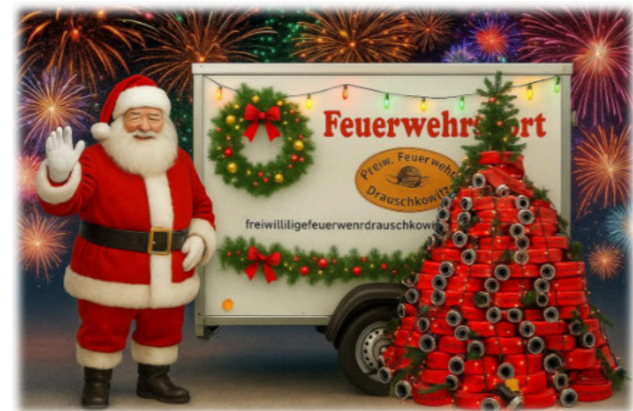
Die Freiwillige Feuerwehr Drauschkowitz e.V. wünscht allen Mitbürgerinnen und Mitbürgern, Kameradinnen und Kameraden sowie deren Familien und Freunden schöne Feiertage und einen guten Start in 2026!