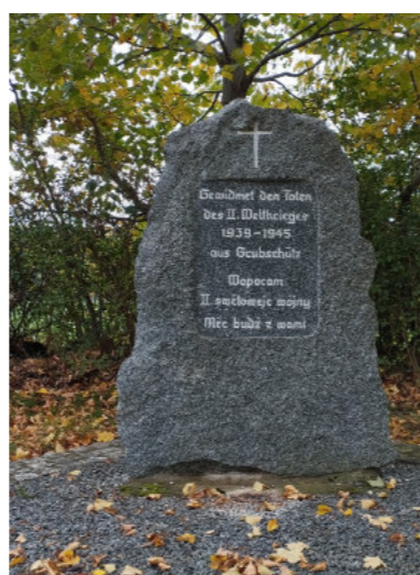
Wir gedenken der Verstorbenen, ruhet in Frieden.