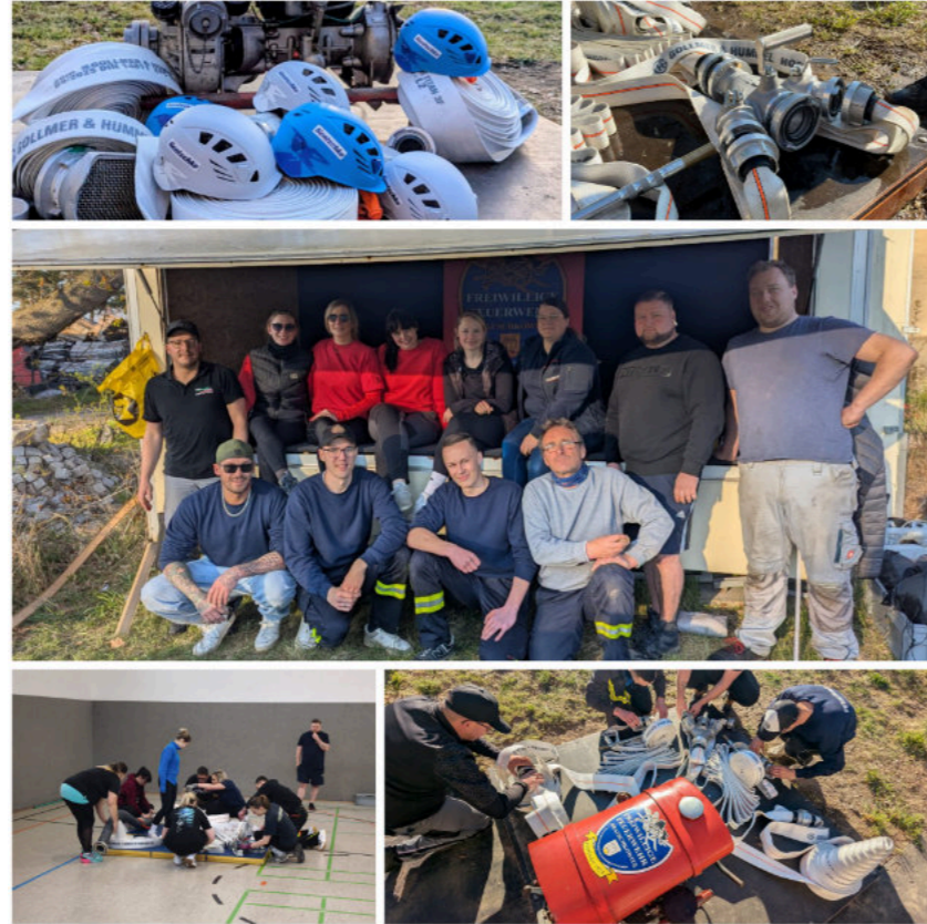
Die Feuerwehr zeigt damit einmal mehr starken Teamgeist und blickt motiviert auf die kommenden Wettkämpfe.

Zudem wurde ein neuer Aufenthalts- und Umkleideanhänger in Betrieb genommen, der mit Unterstützung von GP-Racing zur Verfügung gestellt wurde. Die Materialien zum Innenausbau wurde von der Fußbodenverlegung Mühlstädt bereitgestellt. Auch neue Wettkampfhelme konnten dank Hentschke Bau angeschafft werden.